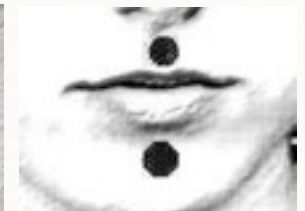
Unter der Nase Kinngrube

Viele Menschen tun sich schwer, einen Partner zu finden, andere leiden unter einer Trennung - Liebesleid droht!