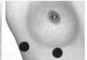
Unter der Achsel Unter der Brust.

Arbeitsfrust, Motivationsschwierigkeiten und Burnout sind heute weit verbreitete Phänomene und bereiten vielen Menschen tagtäglich große Probleme.