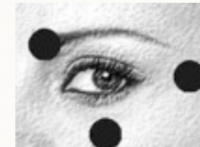
Punkte an den Augen.

Mit den Klopftechniken der energetischen Psychologie können Sie störendes Lampenfieber in den Griff bekommen und Ihre Belastung massiv reduzieren. Diese Technik, die direkt auf Ihr Gefühlszentrum einwirkt, wird dabei helfen, Ihre Nervosität, Angst und Unsicherheit in positive Gefühle zu verwandeln.